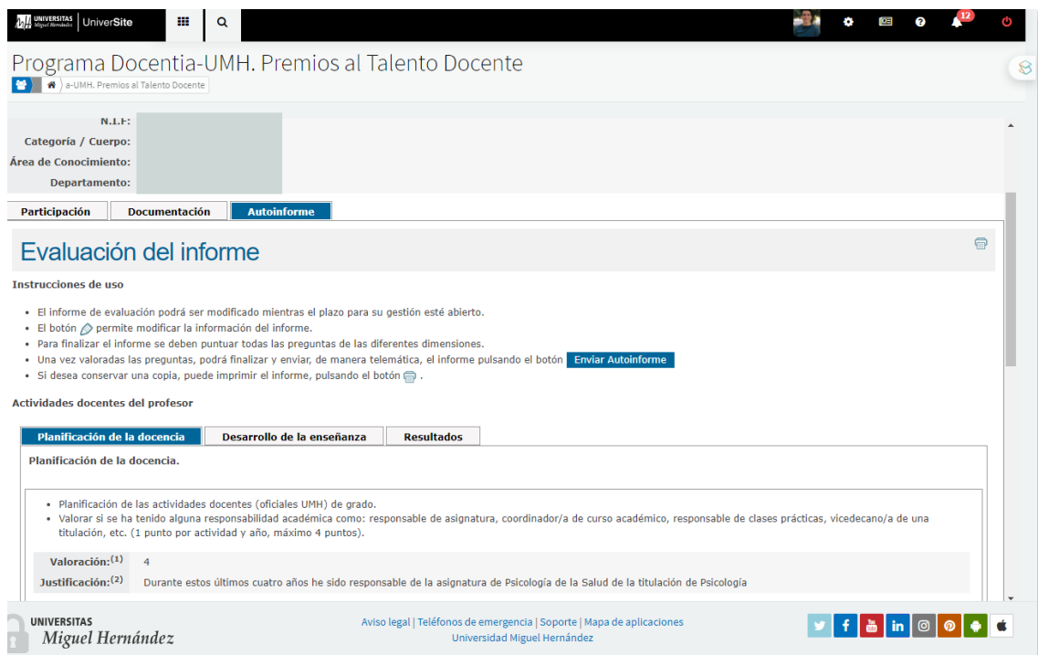
Figura 5. Autoinforme

En la tercera pestaña (figura 5) encontrará la plantilla del autoinforme que el profesorado tendrá que rellenar para poder ser evaluado en el programa DOCENTIA_UMH. Está dividido en las tres dimensiones de evaluación (planificación, desarrollo y resultados).